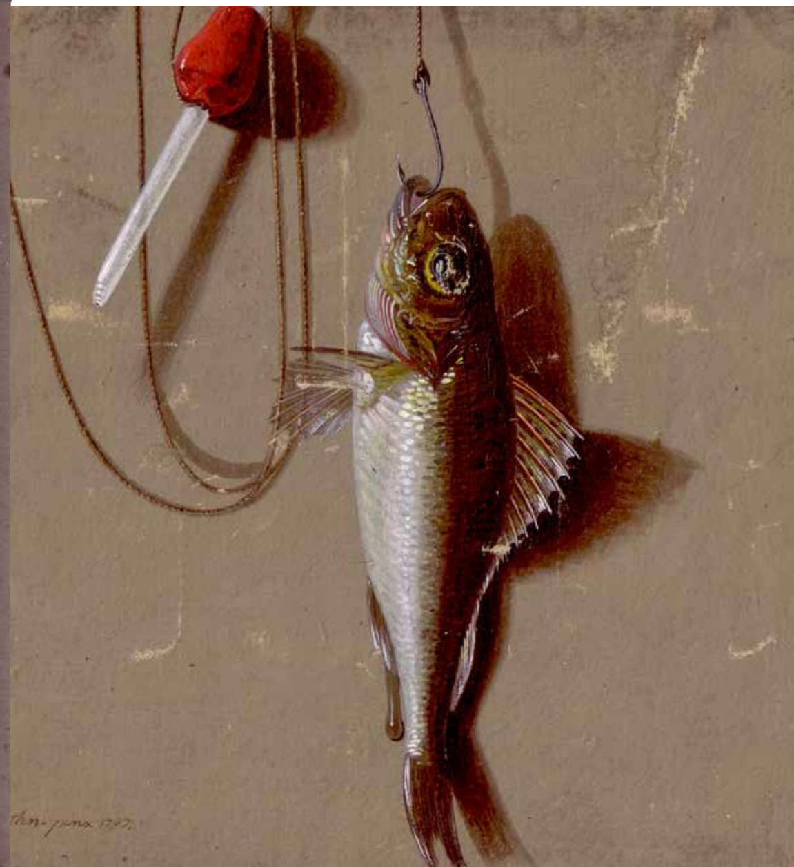
Grafik-Design: Ricarda Alexander-Egge