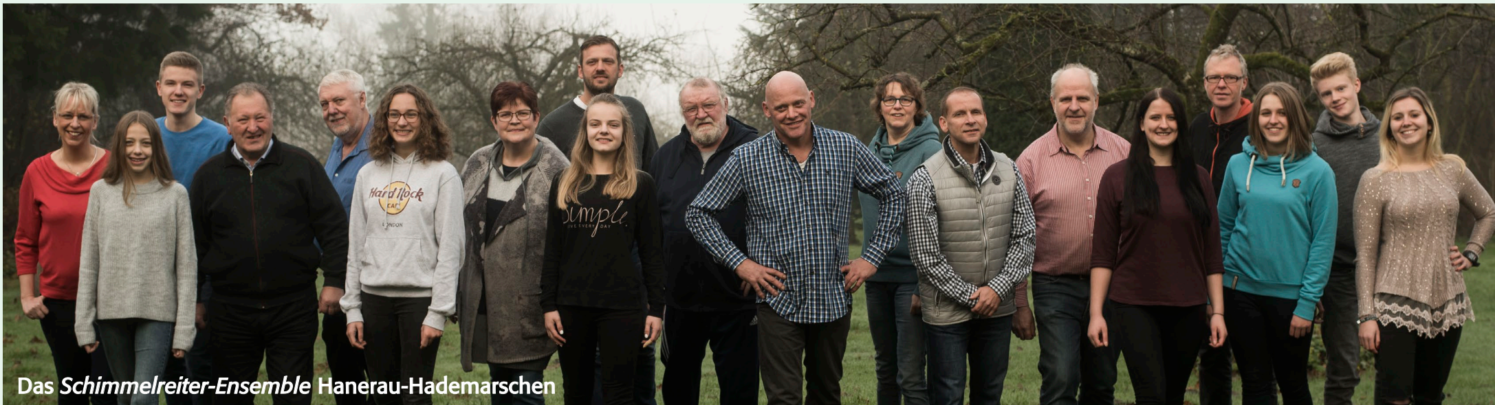
Das Schimmelreiter-Ensemble Hanerau-Hademarschen